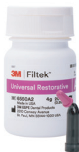
Filtek™ Universal kompole