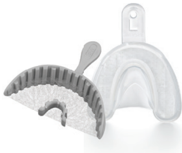
3M™ otiskovací lžíce