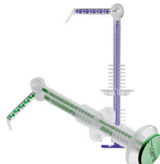
3M™ intraorální aplikační stříkačky