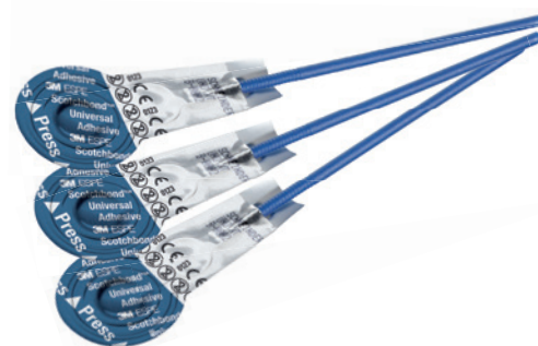
3M™ Single Bond Universal L-Pop