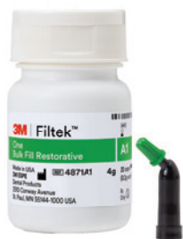
Filtek™ One Bulk Fill kompole