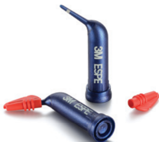
3M™ Adstringentní retrakční pasta

Jednorázové produkty zvyšují efektivitu práce, protože není nutné dezinfikovat a čistit právě použité nástroje a materiály.